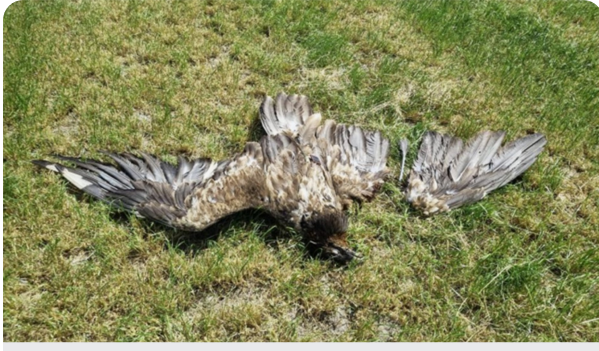
Des rapaces victimes de pales d'éoliennes 30millionsdamis.fr

Les millions de bénéfiques ne suffisent toujours pas à empêcher la mort de nombreux oiseaux!! Dont les programmes de réinsertion coûtent des miles et des cent et son réduit à néant en quelques secondes!!!!